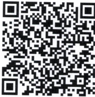
Fig. nº 53 Assinatura

Para facilitar a consulta ou a validação deste documento, use um leitor de QR CODE. Edição com registro número: 0882021